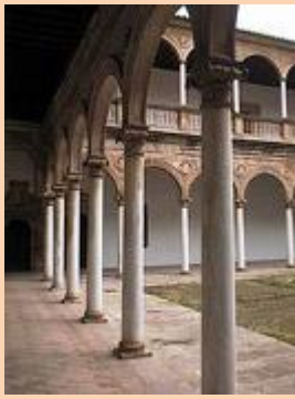
Convento de Calatrava Almagro

Fue fundado en 1504 por el comendador de la Orden de Calatrava Gutierre de Padilla como convento de monjas calatravas. Fue concluido alrededor de 1544.