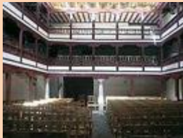
Corral de Comedias Almagro

El conjunto comprende claustro e iglesia. El claustro, de estilo renacentista, tiene planta cuadrangular con cuatro pandas con una doble arcada de arcos de medio punto en la planta inferior y ligeramente escarzados en las superior sobre columnas de una pieza de mármol de carrara con capiteles jónicos y dóricos respectivamente.