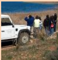
Visita en 4X4

Existen varias modalidades de visita guiada, así como programas de educación ambiental. Visitas Guiadas a pie y/o en vehículos 4x4, talleres de Naturaleza, etc.