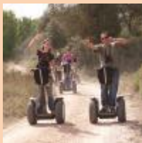
Visita en Segway