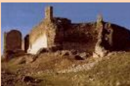
Castillo de Calatrava la Vieja

Fortaleza de orígenes romanos de planta cuadrangular. Conserva dos torres, de las cuales, la más importante es la del Homenaje (Cuatro plantas). La otra torre "Prieta" de menor altura, protegía la puerta del castillo, conservando una cámara interna y la terraza, comunicada con el paso de ronda.