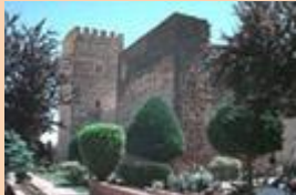
Castillo de Doña Berenguela

Conjunto de fortaleza y monasterio de tipología cisterciense que conserva: * Tres recintos amurallados con puertas de acceso, las dos primeras perimetrales. * Dos plazas de armas con torre del homenaje, dependencias del Gran Maestre, hospedería, horno, anejos y aljibes. * Iglesia de tres naves con capillas laterales, bóvedas de nido de golondrina, restos de decoración mudéjar y rosetón gótico en el imafrente.