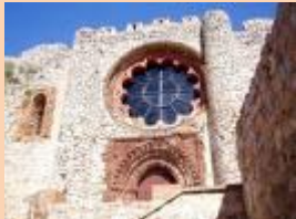
Castillo Sacro-Convento de Calatrava la Nueva

Conjunto de fortaleza y monasterio de tipología cisterciense que conserva: * Tres recintos amurallados con puertas de acceso, las dos primeras perimetrales. * Dos plazas de armas con torre del homenaje, dependencias del Gran Maestre, hospedería, horno, anejos y aljibes. * Iglesia de tres naves con capillas laterales, bóvedas de nido de golondrina, restos de decoración mudéjar y rosetón gótico en el imafrente.