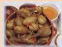
Berenjenas de Almagro